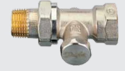
RLV-S Standart Dönüş Vanası