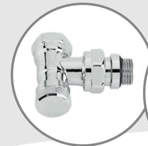
RLV-CX Krom Dönüş Vanası