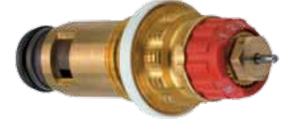
Kompakt Termostatik Radyatör Çekirdeği