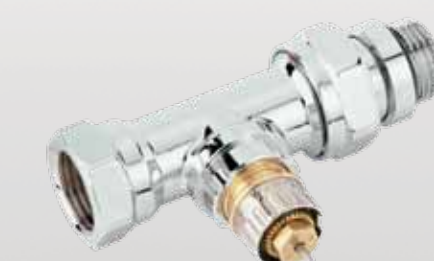
RA-NCX Krom Vana Gövdesi