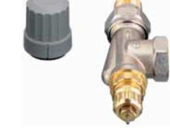
RA-FN Yatay Köşe

■ RA-N Serisi Debi (Reglaj) Ayarlı Vanalar