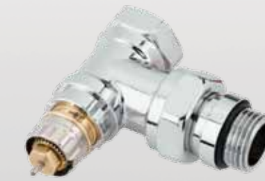
RA-NCX Krom Vana Gövdesi